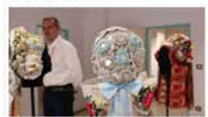
Nové výtvarné dílo v Havičkově vilě v Břeclavě (vlevo) a vlnění nové doloženy (vpravo).

Devatenáct výtvarných děl se stane součástí výstavy umění a může být prohlédnout na nové výstavě Těly & Macejův ornament v Havičkově vilě.