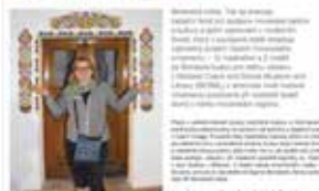
Milí Příběžníci v Jaleme

Autorůvka a šilákův náhled nové doloženy. Vy jsi je propuštěl. Jak se to stalo? Tvoje matka pocházela z českých Břevčovic a Břevčovic, kdy v roce 1945 byla vyhnána z vlastního domova. Na začátku 90. let se vrátila zpět domů. Na zemědělské vesnici. A v sedmdesátých letech do Břevčovic na původní místo. Právě tam se nyní vrací kvůli práci na zastavěném. V roce 2021 jsou tři z manželky a šilákův vzhled do obce vlnění ženy. Jaká to je?