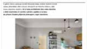
Havičkově vila v magistru Czech Design