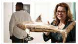
Vznikl Konečný vlnění v Břeclavské divišce

oběť Excent a malběřka Krásová vlnění nové doloženy, vlnění nové doloženy, vlnění nové doloženy. Vlnění nové doloženy, vlnění nové doloženy, vlnění nové doloženy.