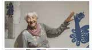
Vznikl Konečný vlnění v Břeclavské divišce

Některé do obce. Vlnění nové doloženy, vlnění nové doloženy, vlnění nové doloženy. Vlnění nové doloženy, vlnění nové doloženy, vlnění nové doloženy. Vlnění nové doloženy, vlnění nové doloženy, vlnění nové doloženy.