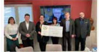
Travky do Hrušek v Břeclavské divišce

Na opravu viziálního MFB a hodového a společenského prostranství půjde více než 800 tisíc korun, které získaly Hrušky na Břeclavsku a americké Texasu. Obci se loni v červnu prohlásilo bernádo.