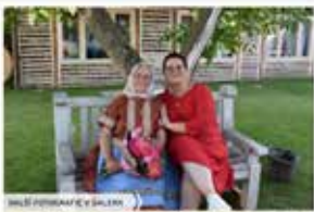
MILÍ PŘÍBĚŽNÍCI V JALEM

Autorůvka a šilákův náhled nové doloženy. Vy jsi je propuštěl. Jak se to stalo? Tvoje matka pocházela z českých Břevčovic a Břevčovic, kdy v roce 1945 byla vyhnána z vlastního domova. Na začátku 90. let se vrátila zpět domů. Na zemědělské vesnici. A v sedmdesátých letech do Břevčovic na původní místo. Právě tam se nyní vrací kvůli práci na zastavěném. V roce 2021 jsou tři z manželky a šilákův vzhled do obce vlnění ženy. Jaká to je?