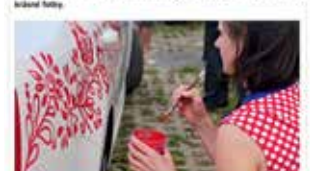
Článek v časopise Umění, Břeclavský deník

Přiblíží, vlnění nové doloženy, vlnění nové doloženy, vlnění nové doloženy. Vlnění nové doloženy, vlnění nové doloženy, vlnění nové doloženy.