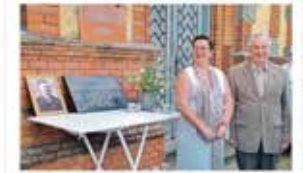
Havičkově vila a malběřka Krásová